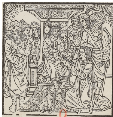
Guerin de Montglave , éd. Michel Le Noir, Paris, ante 1518