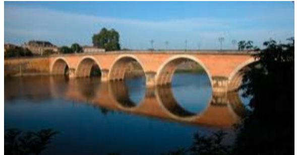
• Bergerac | Ancien Pont | 1565 • • Bergerac | Blason (a) •