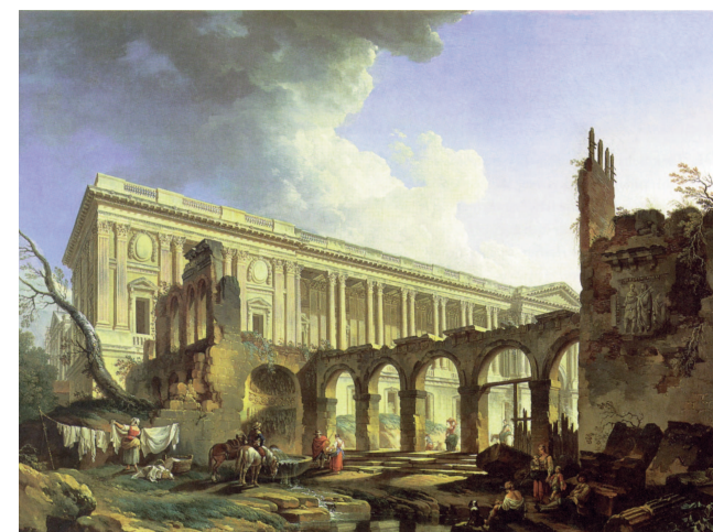
De Machy, Le péristyle du Louvre et la destruction de l'hôtel de Rouillé , 1767 (Collection particulière).

Musée du Louvre - auditorium - salle des 80